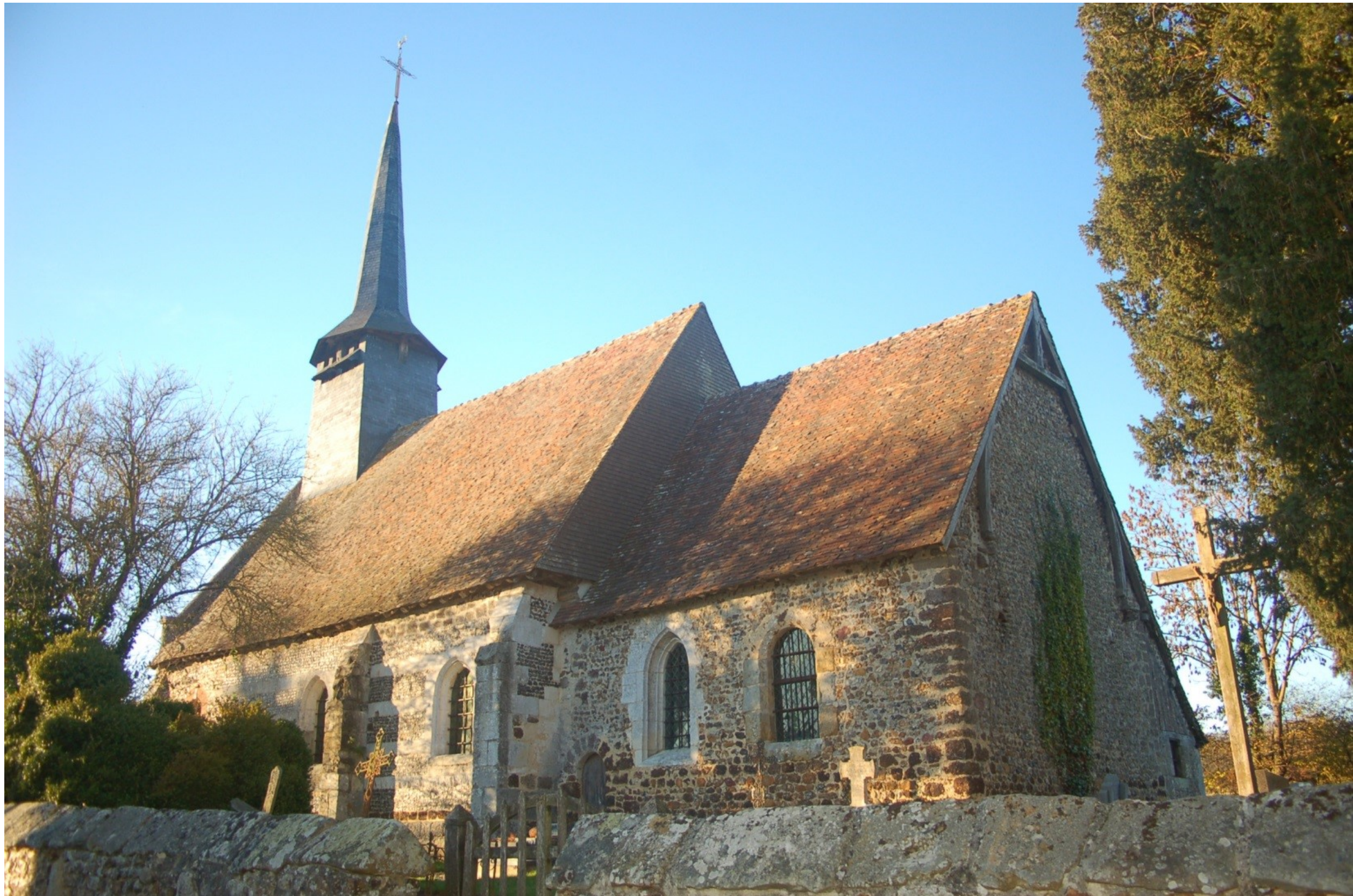
L'église Saint-Ouen-de-Mancelles (Gisay-La-Coudre, Mesnil-en-Ouche) : un exemple d'église rurale à sauvegarder et à valoriser