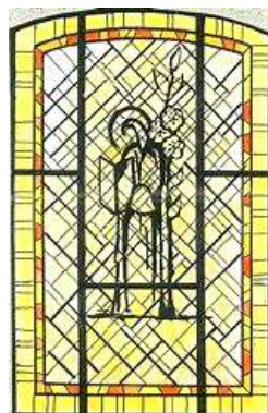
Andé, Eglise Notre-Dame, vitraux de l'atelier Loire