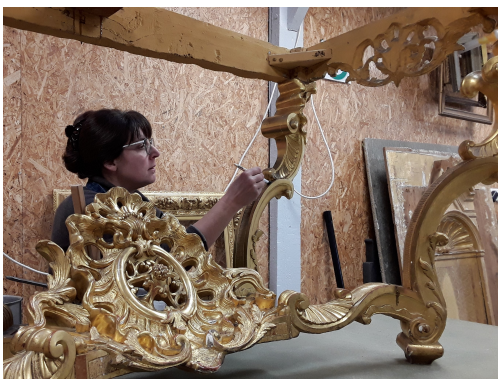
Louviers, Atelier SD Encadrement, restauration d'une console dorée

Cette journée dédiée aux métiers d'art et à la découverte des savoir-faire nous fera partager la passion du bel ouvrage et des objets d'art. Les artisans d'art perpétuent des techniques ancrées dans la tradition et transmettent leur technicité et leur expertise. Si nous percevons une amorce de renouveau, il faut aussi comprendre les problématiques, les enjeux et les perspectives d'avenir des professions vouées au patrimoine.