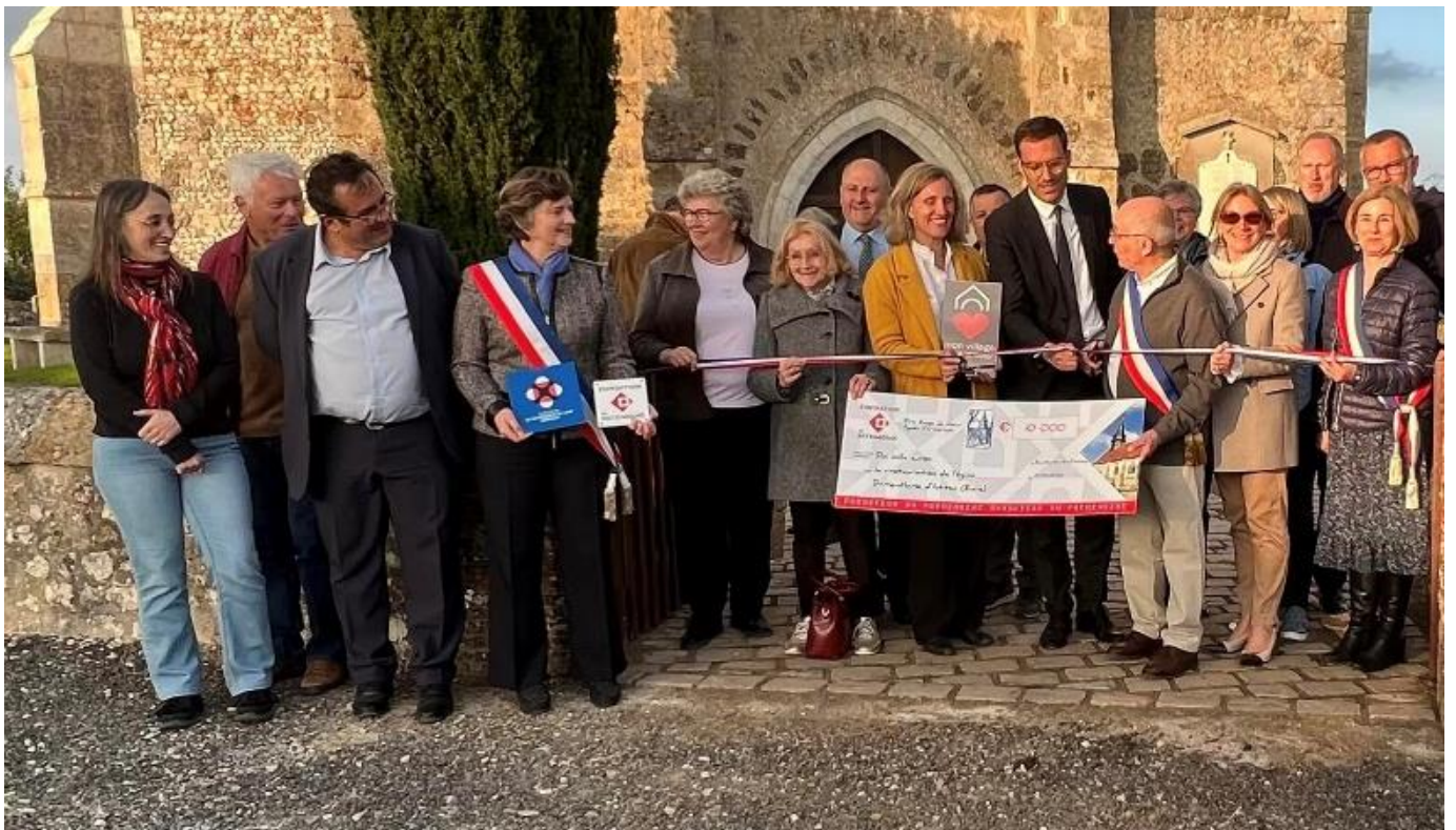
Sainte-Marie-d'Attez, église Notre-Dame de Dame-Marie

Les candidats s'engagent à accepter et respecter les conditions du présent règlement.