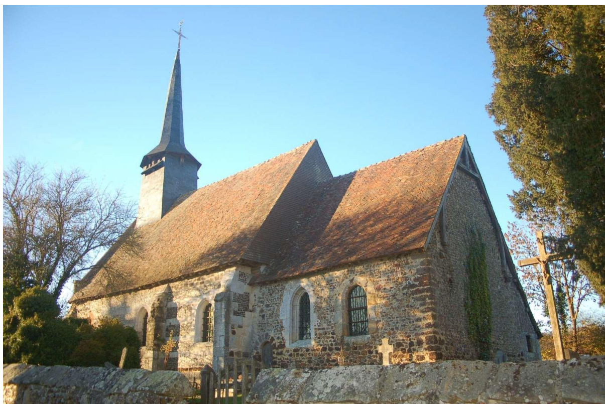
L'église Saint-Ouen de Mancelles, premier « Coup de cœur Agnès Vermersch » Primée en 2011.

C'est dans cet esprit, celui d'aider à la réalisation d'un projet de sauvegarde du patrimoine, que le « Coup de cœur Agnès Vermersch » a été proposé en 2020, 2022, 2024 et à nouveau en 2026.