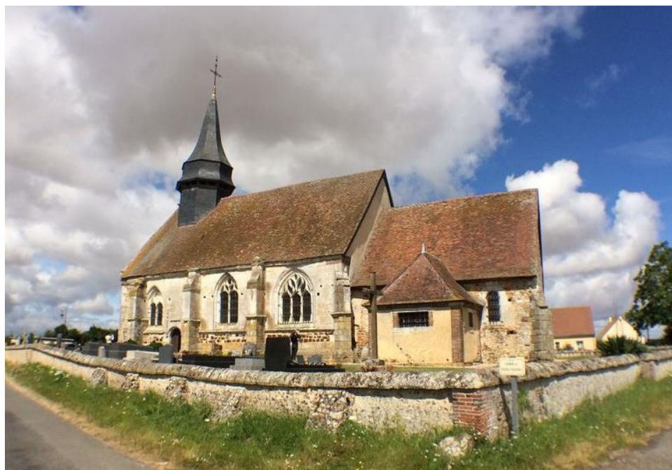
Sainte-Marie-d'Attez, église Notre-Dame de Dame-Marie Troisième « Coup de cœur Agnès Vermersch » Primée en 2022 Restaurée en 2022/2023