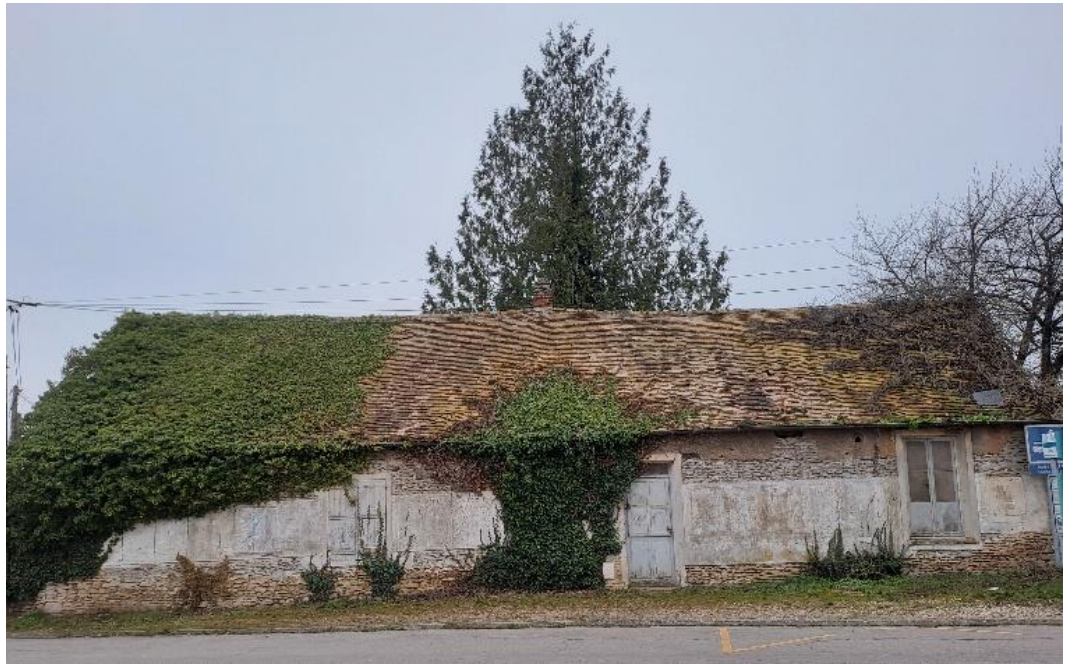
Etat avant travaux

Boncourt Réhabilitation d'une maison de village en pierres de grouette Quatrième « Coup de cœur Agnès Vermersch » Primée en 2024 Restaurée entre 2023 et 2025