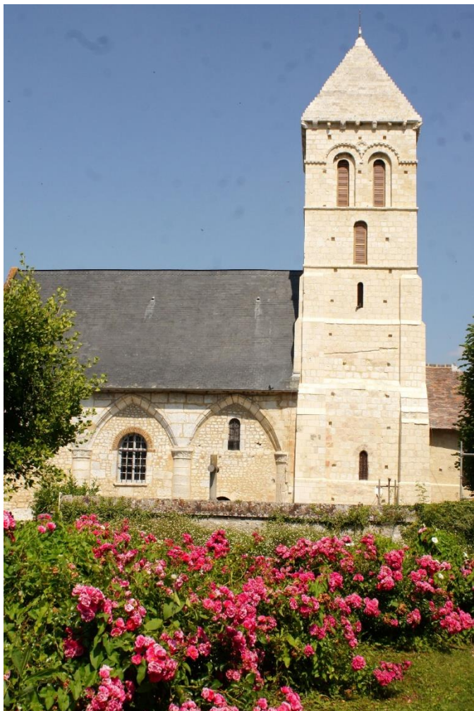
Eglise Saint Pierre d'Aizier Second « Coup de cœur Agnès Vermersch » Primée en 2020 Restaurée en 2020/2021